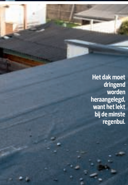
Het dak moet dringend worden heraanlegd, want het lekt bij de minste regenbui.